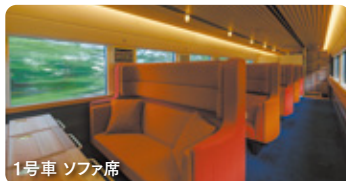
1号車 ソファ席 沿線の「別府・大分」がテーマ。テーマカラーは「赤茶」。大分・別府の風景や竹細工をモチーフにした暖簾や、大分産の杉を使用した大型テーブルと、重厚感のある座り心地良いソファが配置された席。最大3名まで並んで座ることができます。