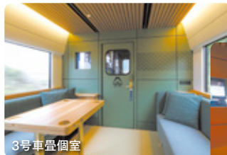
3号車畳個室 靴を脱いで、ゆったり過ごせる畳の床の個室タイプの座席。お子様連れの方やグループの方も気兼ねなく楽しむ事ができます。