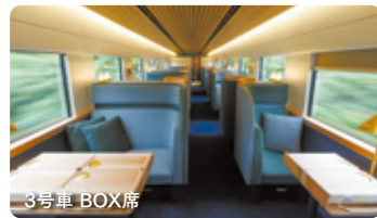
3号車 BOX席 沿線の「福岡・久留米」がテーマ。テーマカラーは「青緑」。福岡・久留米の風景や産業をモチーフにした暖簾や、福岡産の杉テーブルを各BOX席に配置。高い仕切りに囲まれた半個室タイプです。