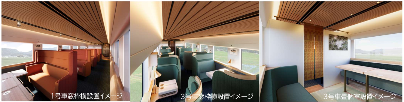
1号車窓枠横設置イメージ

座席の窓枠横や背面、1・3号車の乗降口など各所に設置いたします。車内を散策しながら、異なるテーマの作品を楽しむことができます。また、畳個室には専用のアート作品も設置いたします。